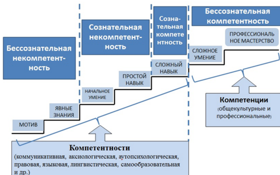
Рисунок 1 – Процесс накопления компетентности

Компетентность формируется на этапах (ступеньках) мотивов, явных знаний, начальных умений, простых и сложных навыков [7]. Процесс накопления компетентности (знаний, навыков, умений) проходит ряд (четыре) стадий (рисунок 1).