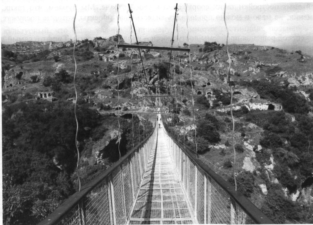
Рис. 2. Висячий мост в селе Хндзореск

международной арене. При этом курорт Корловы Вары начал приобретать нынешнюю мировую известность не так давно, в основном после бархатной революции 1989 г. Потом наступило время предпринимательской активности, начался приток местных и иностранных инвестиций. Десятки санаториев и гостиниц в результате реконструкции вышли на уровень мировых стандартов. История развития туризма в Карловых Варах может являться хорошим примером для развития Джермука.