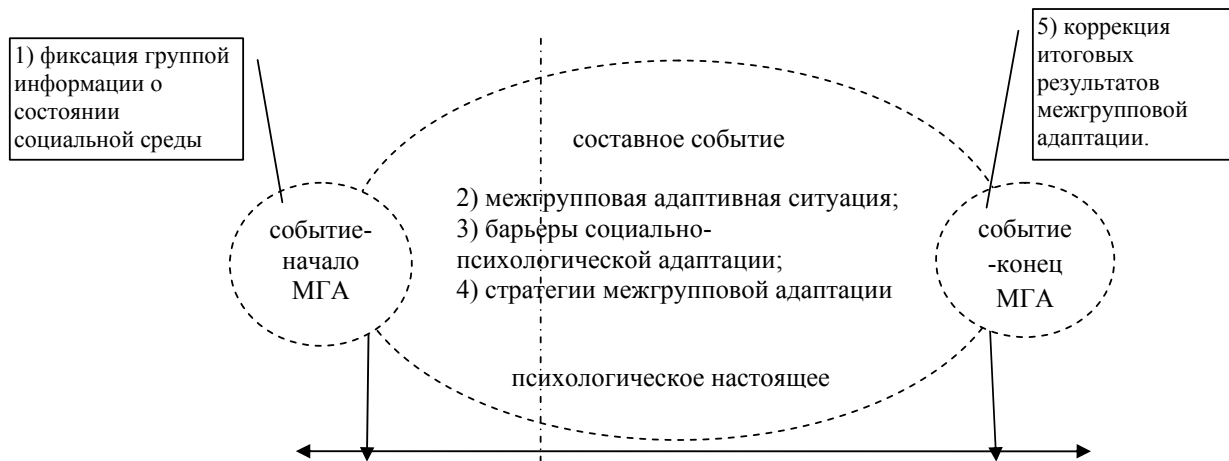
Рис. 3. Временная структура межгрупповой адаптации

Таким образом, начальное и конечное – элементарные события связаны друг с другом как начало и конец единого однородного процесса. Указанные три элемента образуют составное событие – межгрупповую адаптацию.